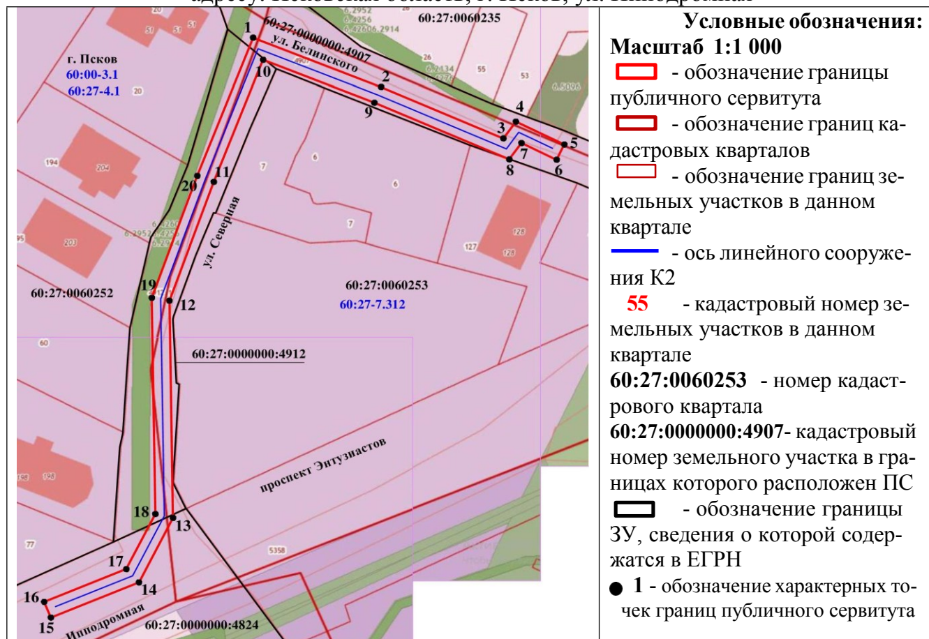
Схема расположения границ публичного сервитута на земельных участках с кадастровыми номерами: 60:27:0000000:4907 расположенном по адресу: Псковская область г. Псков, ул. Белинского; 60:27:0000000:4912 расположенном по адресу: Псковская область, г. Псков, ул. Северная; 60:27:0000000:4824 расположенном по адресу: Псковская область, г. Псков, ул. Ипподромная