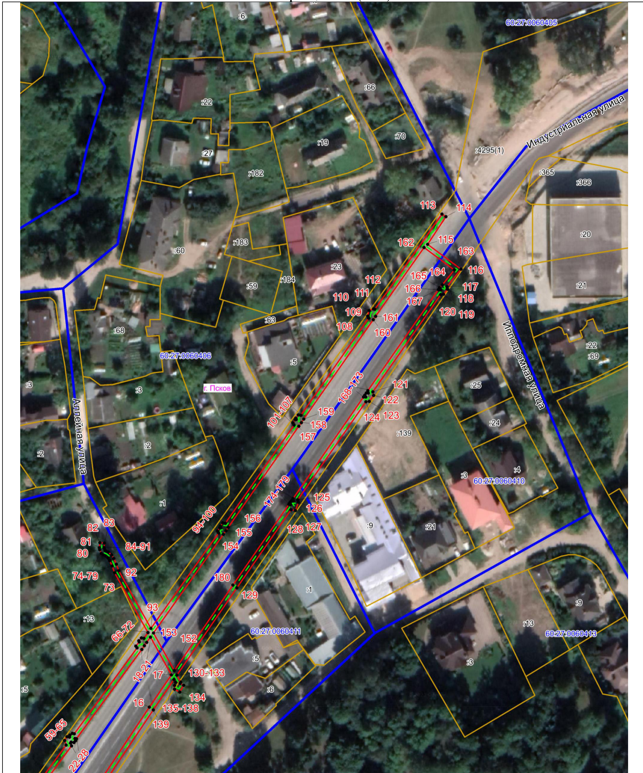
План границ объекта (лист 2)

Публичный сервитут объекта электросетевого хозяйства КЛ-0,4 кВ ТП №85 УО Инд, Инж Заводск; УО моста ч/з р.Пскову ул.Инд доИпподр; УО оп.Аллеяная и Инд; УО. Островск и пл.жертв Революции (наименование объекта, местоположение границ которого описано (далее - объект))