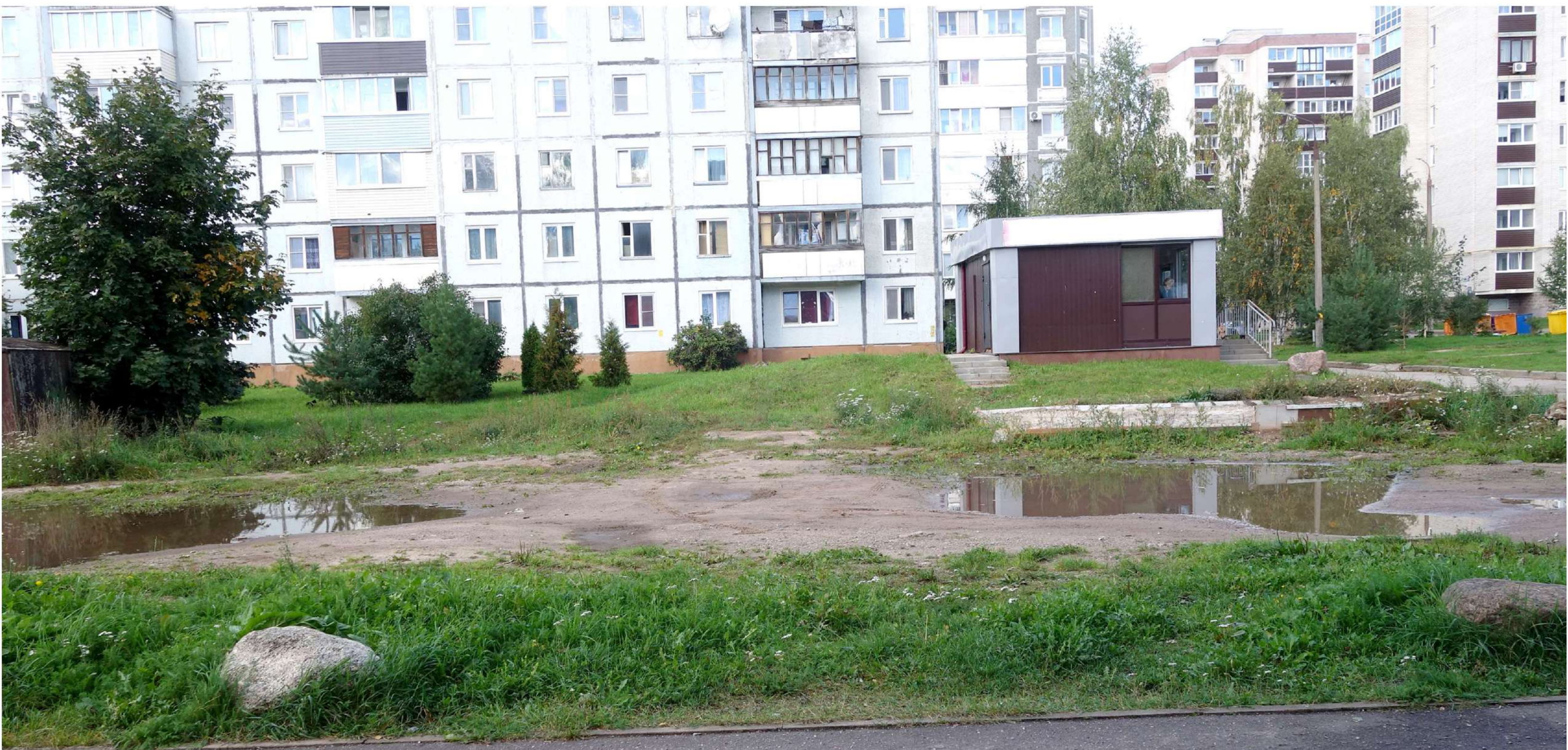
Участок для сада-минисквера - фото 2023 г.