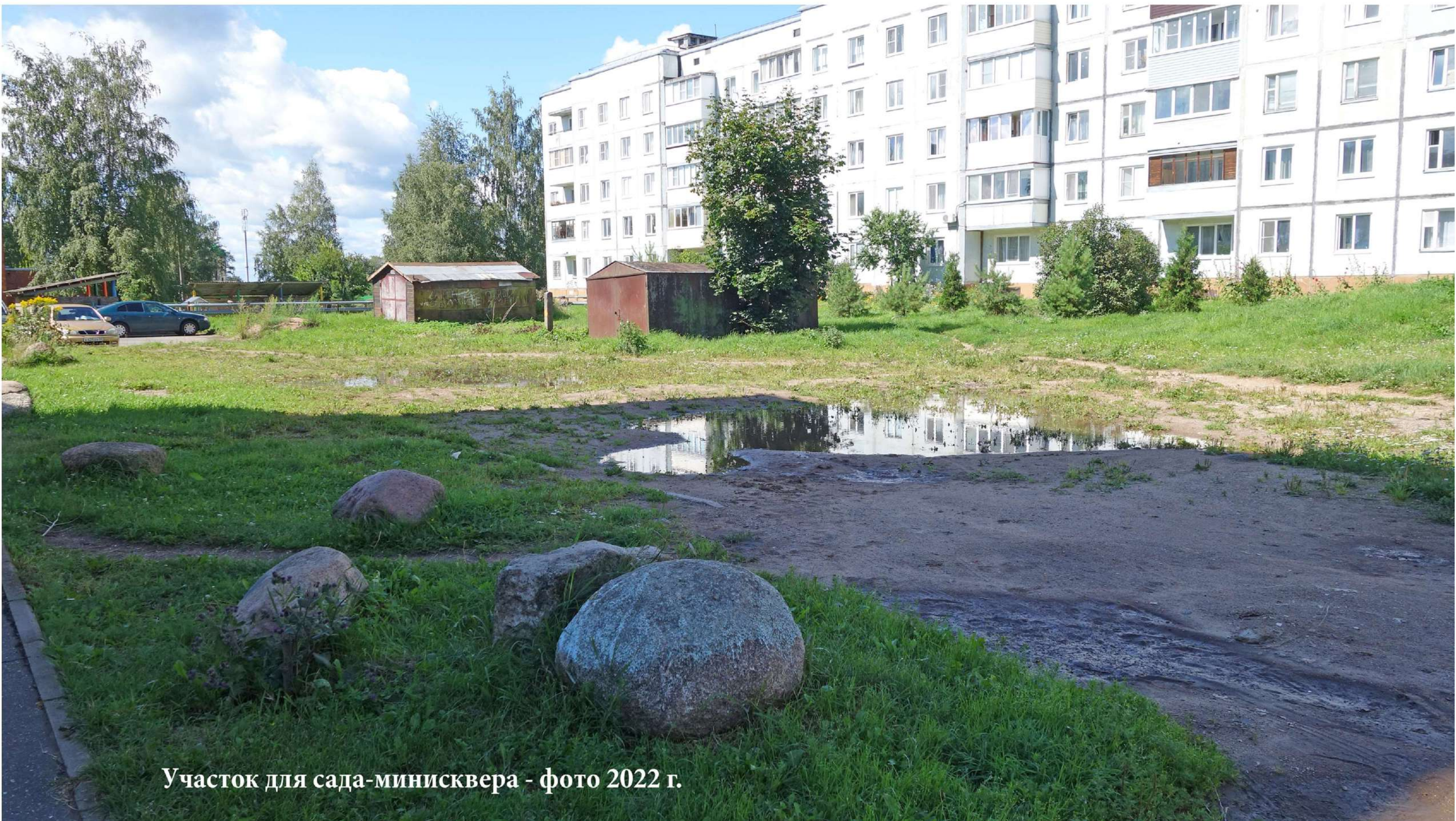
Участок для сада-минисквера - фото 2022 г.