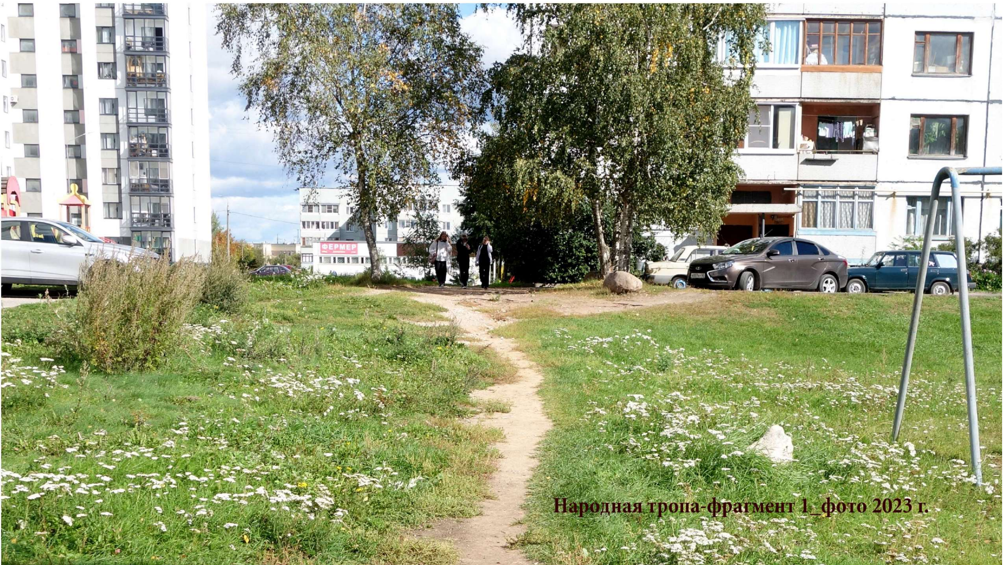
Народная тропа-фрагмент 1_фото 2023 г.