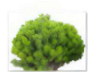
Сосна горная Mughus.png