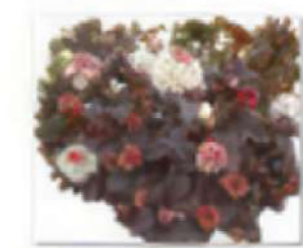
Пузыреплодник калинолистный. png