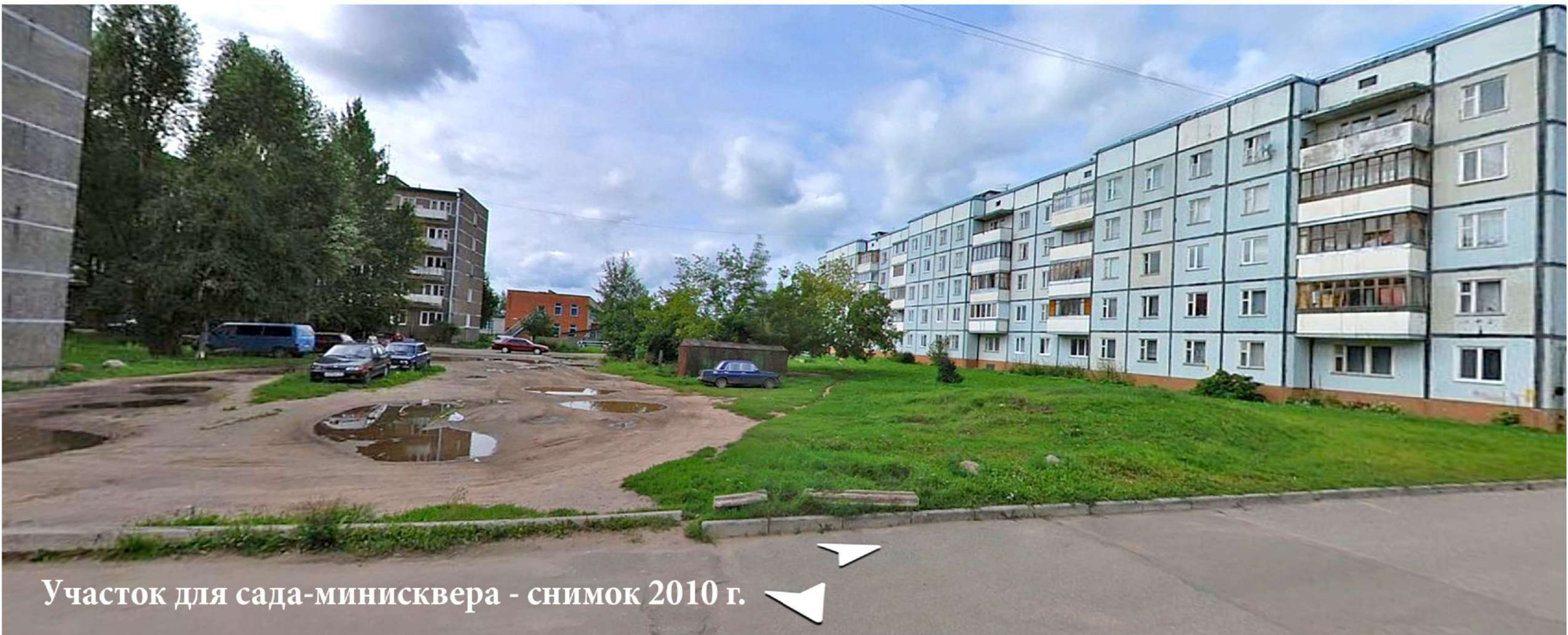
Участок для сада-минисквера - снимок 2010 г.