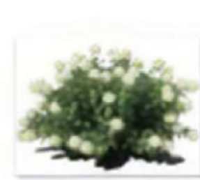
Гортензия древовидная.рп 9