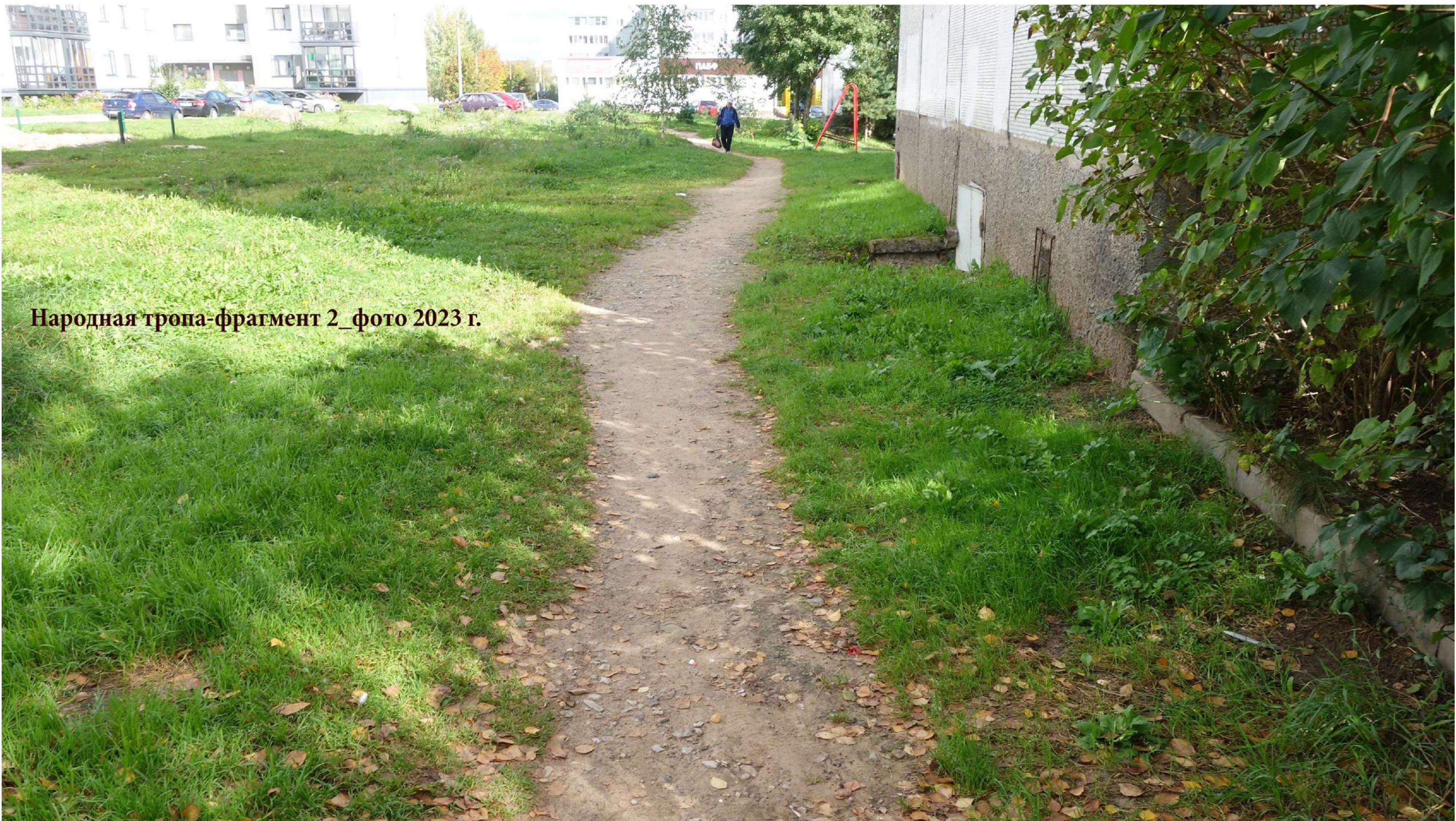
Народная тропа-фрагмент 2_фото 2023 г.